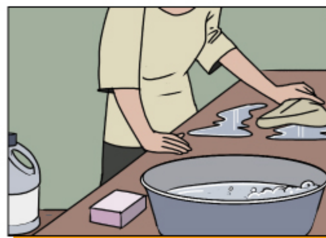
ทำความสะอาดพื้นผิว ของสิ่งที่เป็นหวัดใหญ่ได้สัมผัส โดยใช้สบู่กับน้ำ