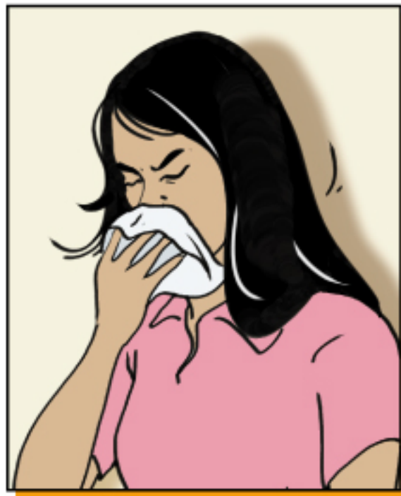
ปิดปากและจมูกด้วยกระดาษทิชชู หรือผ้าเมื่อไอหรือจาม