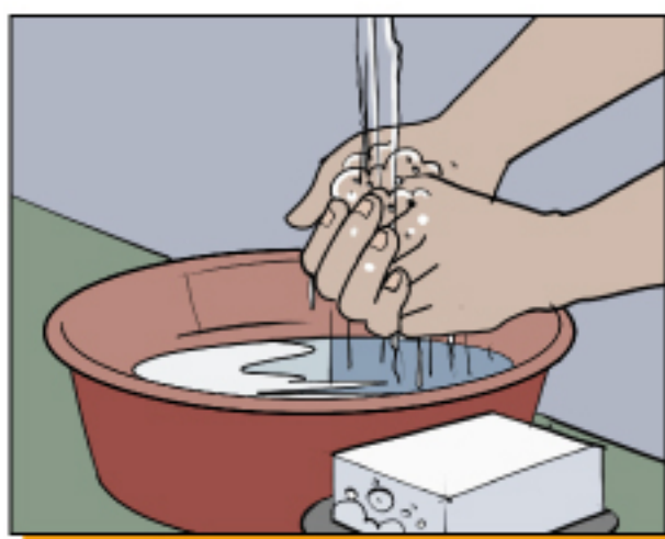
ล้างมือด้วยสบู่กับน้ำบ่อยๆ