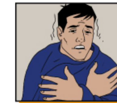
ตัวสั่นโดยไม่สามารถควบคุมได้

นอกจากนี้ยังสามารถอ่านข้อมูลได้จาก www.pandemicpreparedness.org