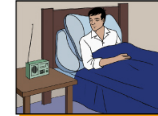
คอยติดตามประกาศต่างๆ จากผู้ที่เป็นผู้นำในพื้นที่ สื่อวิทยุและโทรทัศน์ หรือโทรศัพท์สายด่วนต่างๆ เพื่อทราบข่าวสารล่าสุดเกี่ยวกับข้อควรปฏิบัติต่างๆ