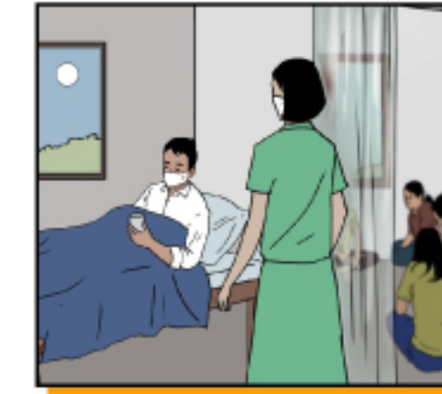
จัดพื้นที่แยกต่างหากไว้สำหรับดูแลผู้ป่วย โดยให้มีระยะห่างจากคนอื่น ๆ ในบ้านอย่างน้อย 2 เมตร