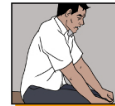
หายใจติดขัด

ติดต่อหรือเข้ารับการรักษาที่สถานพยาบาลเมื่อมีอาการรุนแรงเท่านั้น เช่น