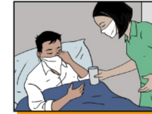
ให้ผู้ป่วยดื่มน้ำและรับประทานอาหารมากๆ เพื่อหลีกเลี่ยงสภาวะที่ร่างกาย สูญเสียน้ำมากเกินไป