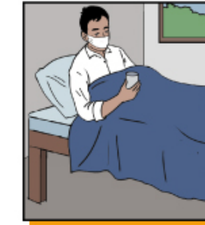
ให้ผู้ป่วยสวมหน้ากากอนามัย หรือคาดปากและจมูกด้วยผ้า