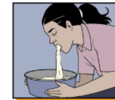
อาเจียนหรือ ท้องเสียอย่างรุนแรง