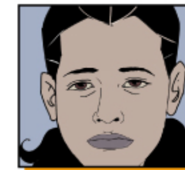
ริมฝีปากและ ใบหน้ามีสีม่วงคล้ำ