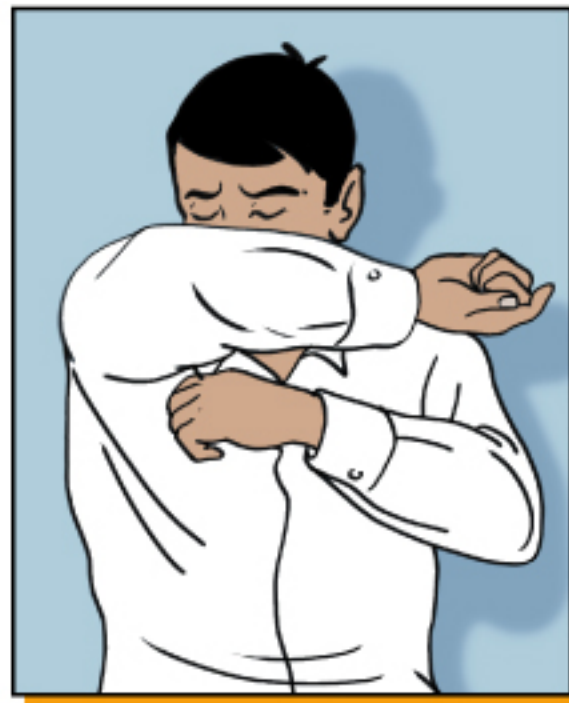
ใช้ข้อพับแขนปิดปากและจมูกเมื่อไอหรือจาม