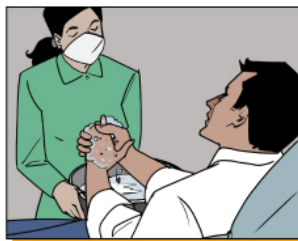
ให้ผู้ป่วยล้างมือบ่อยๆ ด้วยเช่นกัน